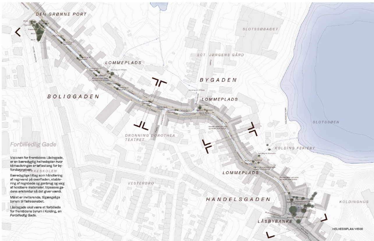
Illustration fra Helhedsplan for Låsbygade

Der er udarbejdet en helhedsplan for Låsbygade, som ud over at klimasikre området, løfter området med en tiltrængt gaderumsfornyelse. Ved gennemførelse af helhedsplanen, kan man bruge økonomien for retablering af belægninger til lægning af nye belægninger og der ville kunne udføres flere tiltag til håndtering af overfladevandet, såsom etablering af regnbede for opmagasinering og rensning af vandet. Disse bede vil samtidig bidrage til forskønnelse af gaden.